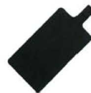
plaque patient en silicone