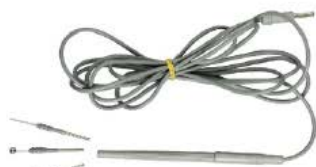
Manche avec Electrodes autoclavables