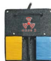
Pédale Monopolaire Double