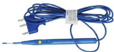
Manche Jetable à Pen avec Interrupteur Manuel