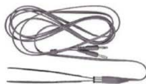
pince bipolaire autoclavable